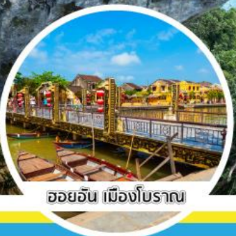
ฮอยอัน เมืองโบราณ